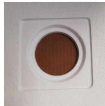
Detalle del orificio de desagüe