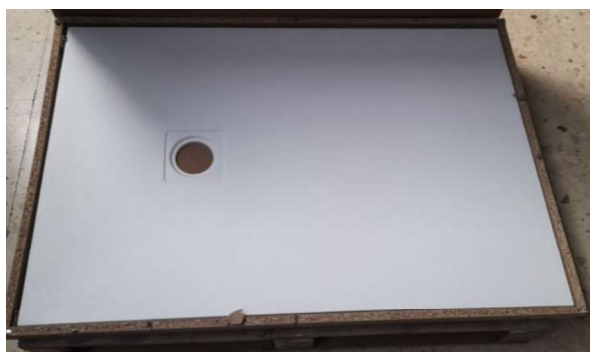
Muestra AIDIMME 2312112-01

Muestra referenciada por AIDIMME como 2312112-01